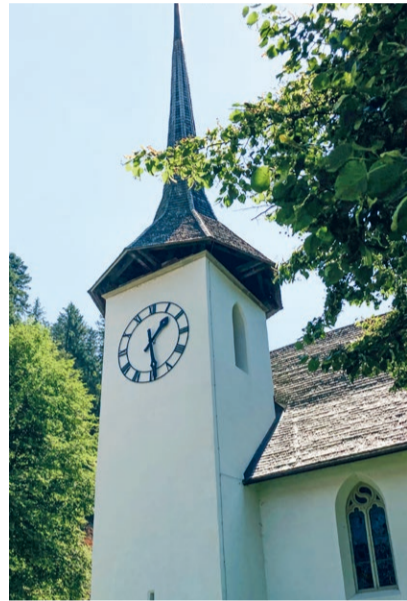
Kirche Eggiwil